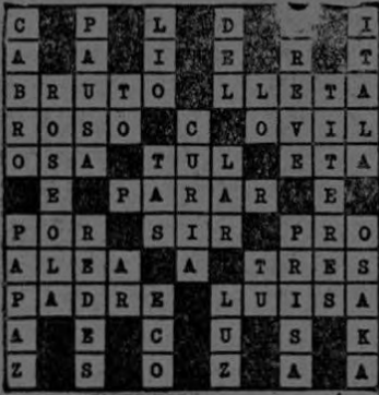
Solución del Crucigrama N° 29.

movidos por un engranaje y un malacate, entran vacíos en el pezo y salen llenos de agua.